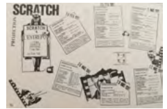
Carteles de algunas de las proyecciones de Scratch.

me proponían una proyección de mis películas llevaba un segundo programa de películas francesas contemporáneas y a menudo tuve dos noches de sesiones para mostrar estos programas en ciudades como Nueva York, Los Angeles, San Francisco, Chicago, Londres, Toronto, Montreal, Buffalo... Fue igual cuando fui a Nueva Zelanda, a donde llevé tres programas de películas francesas junto a uno mío. Las proyecciones fueron importantes porque mostraron que había una escena cinematográfica viva en Francia, y han favorecido el reconocimiento de algunos cineastas franceses en el extranjero. Además de eso organizábamos eventos especiales como "Películas