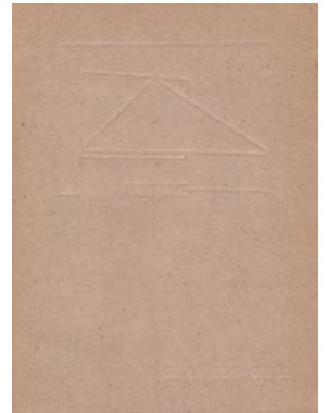
Algunos de los primeros catálogos de Light Cone